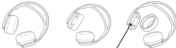
Nalepnica s tehničkim podacima

Da biste zamenili jastučce za uho, poravnajte jastučce za uho sa unutrašnjim okvirom. Pritisnite ga u okvir sve dok ne klikne na svoje mesto.